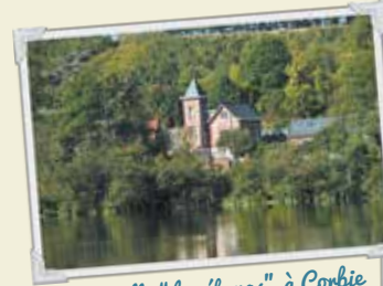
La villa "les étangs" à Corbie