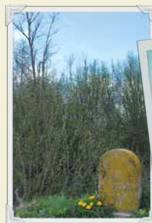
4 Borne kilométrique du canal