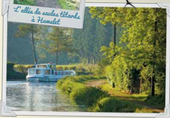
En péniche sur le fleuve...