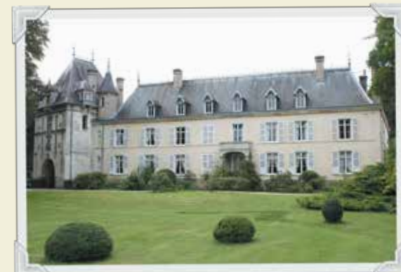
17 Le château de Méricourt