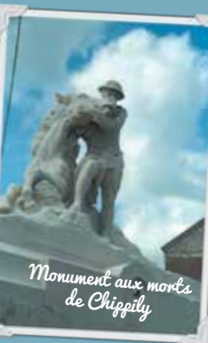
Monument aux morts de Chippilly

21 Chippilly abrite l'un des nombreux oppidums qui s'égrainent au fil de la Somme. Les Gaulois utilisaient ces promontoires naturels comme refuges pour leurs tribus, leurs biens et leur bétail en cas de danger. En photo, le monument aux morts.