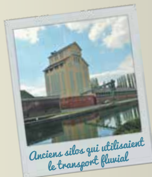
Anciens silos qui utilisaient le transport fluvial