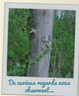
De curieux regards vous observent...