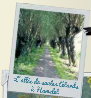
L'allée de saules têtards à Hamelot