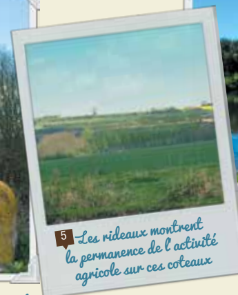
5 Les rideaux montrent la permanence de l'activité agricole sur ces coteaux