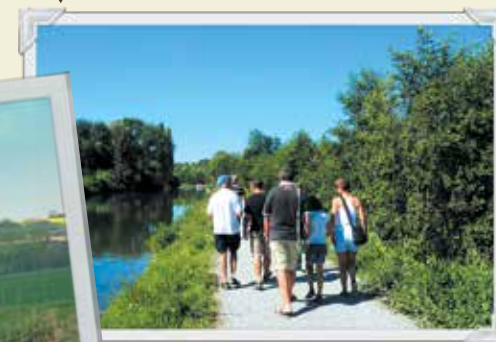
La véloroute à pied aussi !