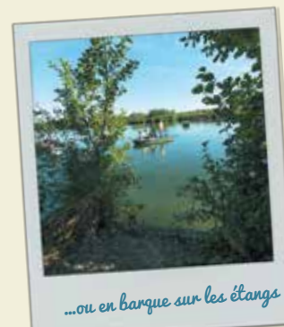
...ou en barque sur les étangs